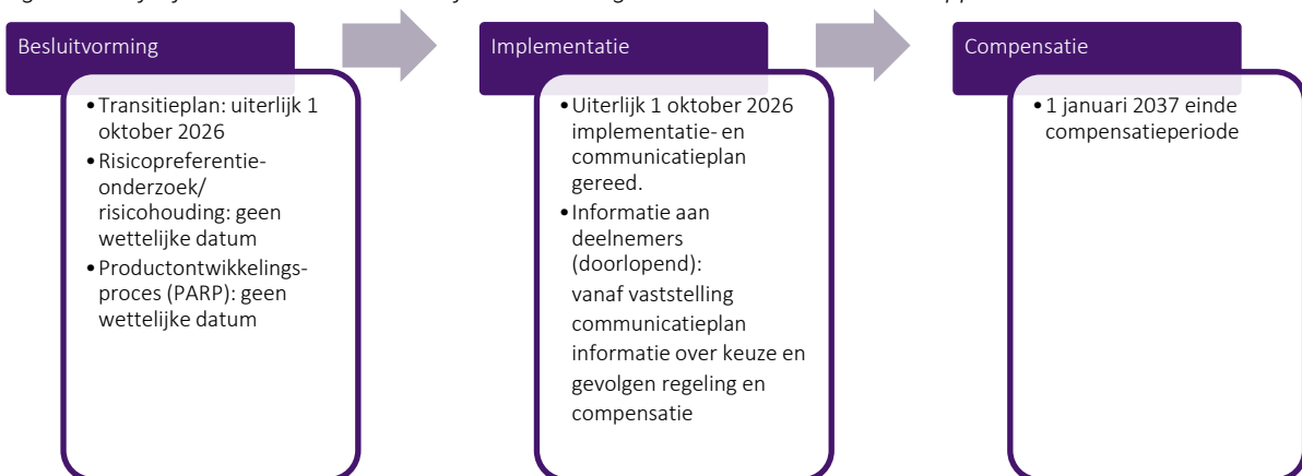
Figuur B - Tijdlijn transitie. Deze wettelijke deadlines gelden voor verzekeraars en ppi's.

Bovengenoemde tijdlijnen zijn specifiek van toepassing voor pensioenfondsen. Voor verzekeraars en premiepensioeninstellingen zijn niet alle onderdelen uit Figuur A van toepassing, omdat zij bijvoorbeeld niet te maken hebben met de keuze voor het transitie-ftk. Op hoofdlijnen zijn de stappen en de termijnen echter wel vergelijkbaar. Ook bij verzekeraars en premiepensioeninstellingen dient bijvoorbeeld een transitieplan te worden ingediend, als geen gebruik wordt gemaakt van de eerbiedigende werking. Voor hen geldt een latere uiterste inleverdatum van het implementatie- en communicatieplan. Dit is in figuur B weergegeven.